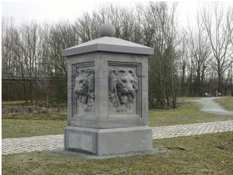
Onbekend – Steunbeer leeuwenkoppen