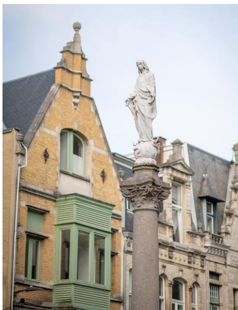
Alfons Jozef Strymans – Madonna op zuil