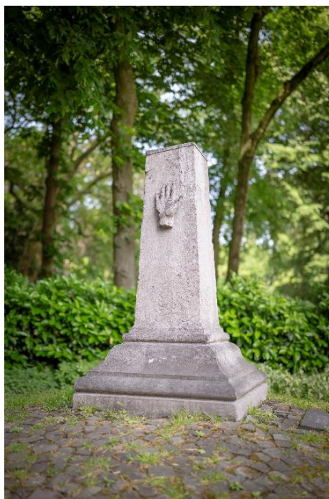
Onbekend – Grenspaal 'De Hand'