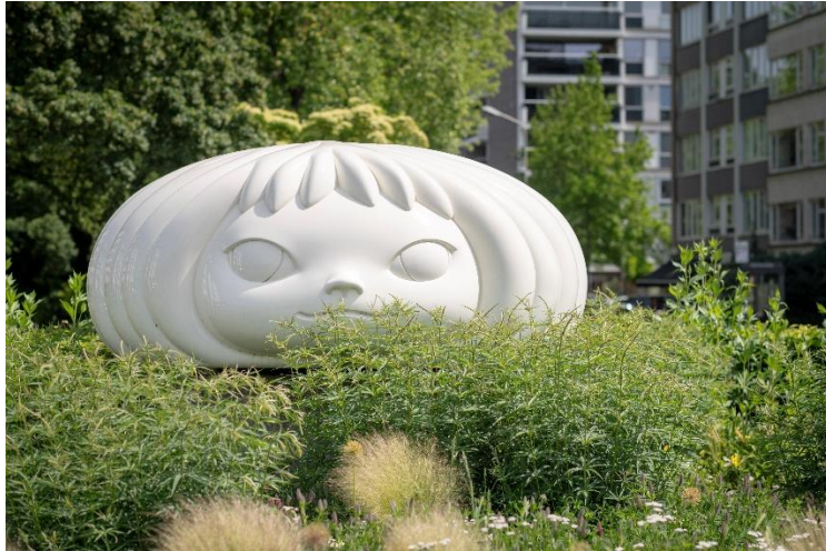
Yoshitomo Nara – Puff Marshie