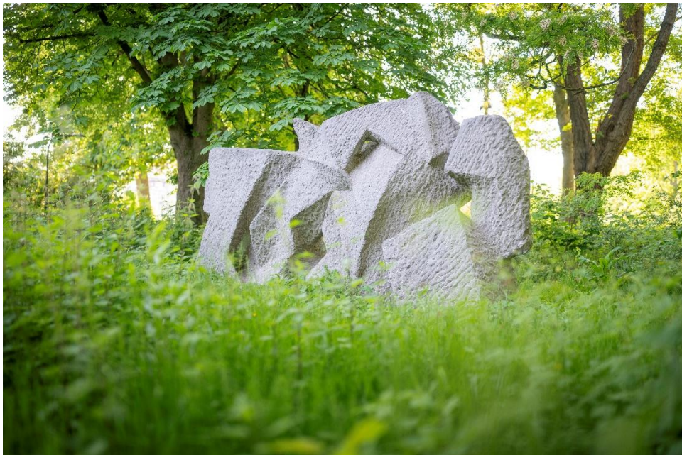
Dominique Stroobant – De kinderen noemen het een olifant