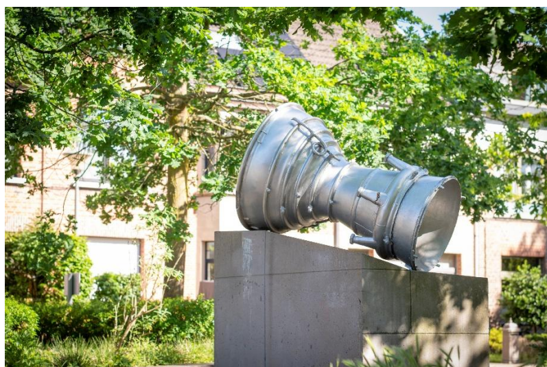
Onbekend – Gedenkteken slachtoffers V-bommen